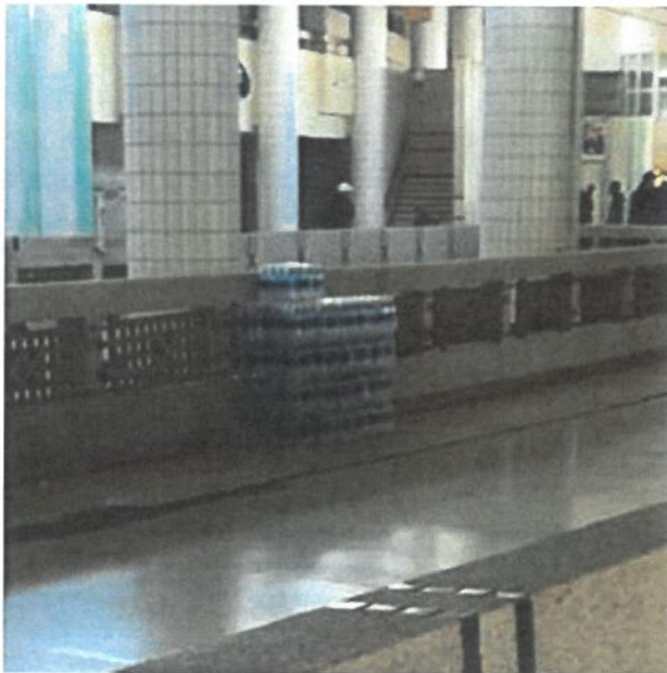
Un stock d'eau minérale, Gare Oulad Ziyane – Sous Autorisation-

L'ère nouvelle foisonne de moult défis à l'échelle universelle, mais celui qui pèse de tous est celui de la protection de l'environnement, le mot « vert » résonne partout depuis la période de la fin-guerre mondiale, des partis politiques verts, des villes vertes, des énergies vertes même des moyens de transports verts ; ceci dit que ces organisations et moyens contribuent au développement humain sans nuire à sa santé ou impacter son environnement par la pollution ou d'autres charges destructives, comme le soulignent les objectifs surtout de douze à quinze du développement durable préconisés par les nations unies afin de garantir un avenir meilleur pour tous.