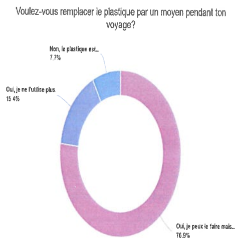
Résultats du sondage électronique

80% est prête à l'adoption de nouvelles alternatives, et d'après nos mêmes enquêtés, la solution proposée est le verre.